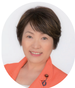
文部科学大臣 衆議院議員