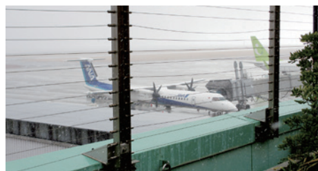
滑走路にもほんのり雪が…