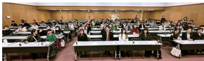
日本看護連盟岡山幹事を囲んで