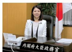
内閣府大臣政務官 内閣府政務官室にて