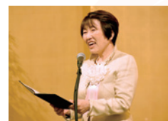
文化功労者顕彰式にて お祝いのご挨拶

かつてないスピードで不確実性や複雑性が増す時代、みなさまの声を聴かせていただき、人材育成のための教育は国の基と信じて、日々努力して参ります。看護は、命を慈しみ、大切な人を護るための知識と技術が学べる素晴らしい仕事であると、次世代に胸を張って伝えられるよう看護職の地位向上や環境改善にみなさまと共に全力で取り組んで参ります。