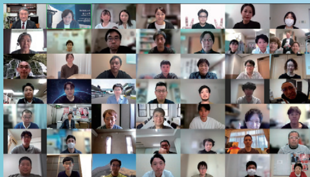
石田 まさひろ参議院議員と写真撮影