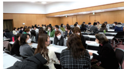
グループワークと発表