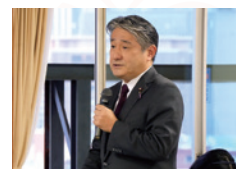
政調全体会議 (2024年総合経済対策(案)への発言)