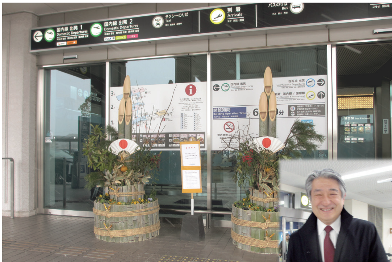
大分空港の玄関口に飾られた門松