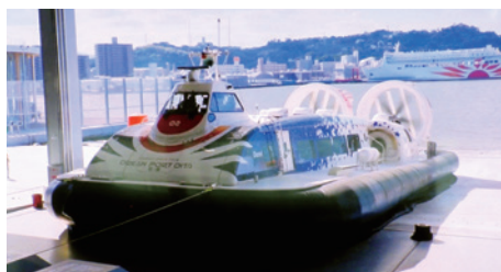
もうすぐ活躍?! ホーバークラフト